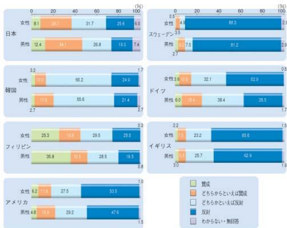
第20図 固定的性別役割分担意識（夫は外で働き、妻は家庭を守るべきである）

（備考）内閣府「男女共同参画社会に関する国際比較調査」（平成14年度）、「男女共同参画社会に関する世論調査」（平成14年7月）より作成。