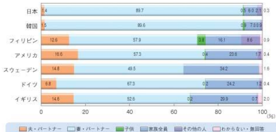
第22図 家事分担の状況（食事の支度）（男女計）

（備考）内閣府「男女共同参画社会に関する国際比較調査」（平成14年度）、「男女共同参画社会に関する世論調査」（平成14年7月）より作成。