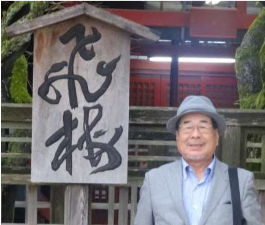
大宰府天満宮参拝