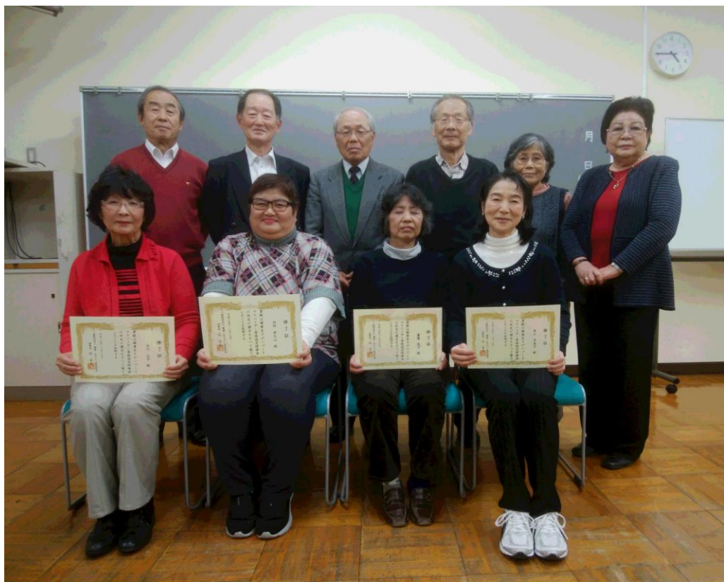
2 日目終了後、講師と共に記念スナップ

認定受講者 4 名に磯理事長から 修了書が授与されました。 皆様、おめでとうございます。