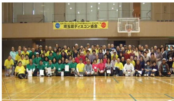
埼玉県ティスコン・オープン大会 (平成27年11月 所沢市)