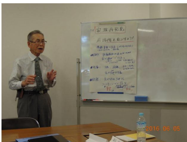
グループ1 テーマ:「家族再発見」