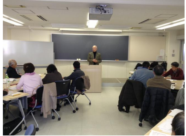
ロープレのポイントとコメント表記入の仕方