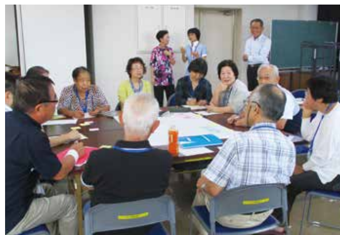
栗東100歳大学で、グループワークを行う受講生たち

授業への出席率は85～95%とたいへん高く、元気高齢者の学習への意欲の高さがうかがえます。