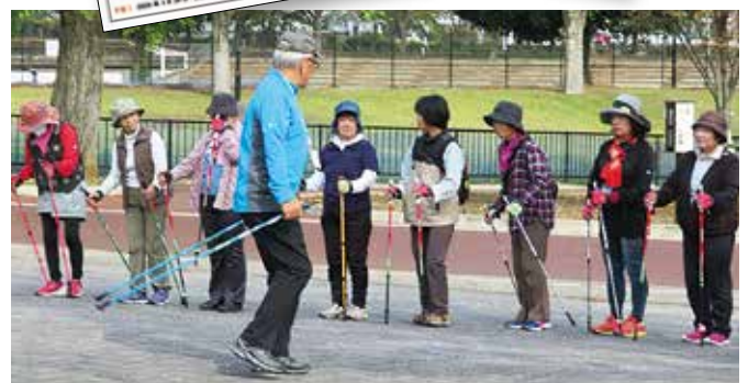
ノルディックウォーキング定例講習会

会員同士をつなぐ「ふれあいニュース」と「ポールウォーキング講習会のお知らせ」ハガキ