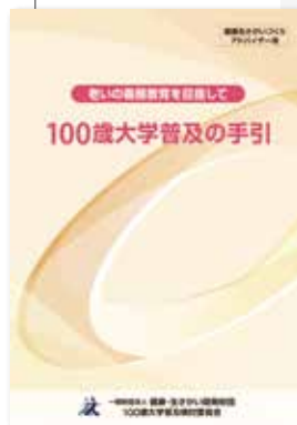
「100歳大学」を普及させるための手引書