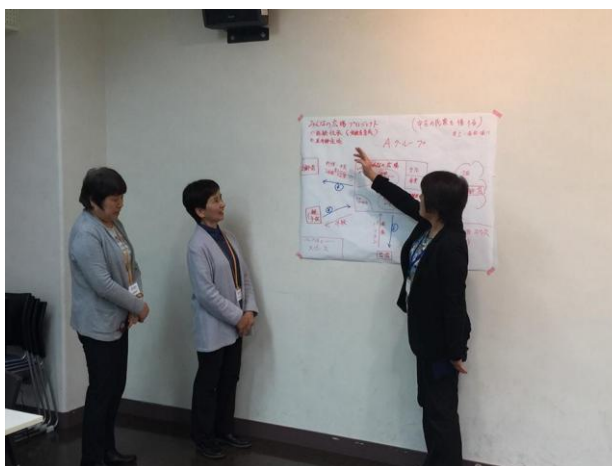
女性3名のグループによるプレゼン