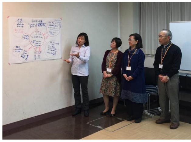
女性3名男性1名グループによるプレゼン