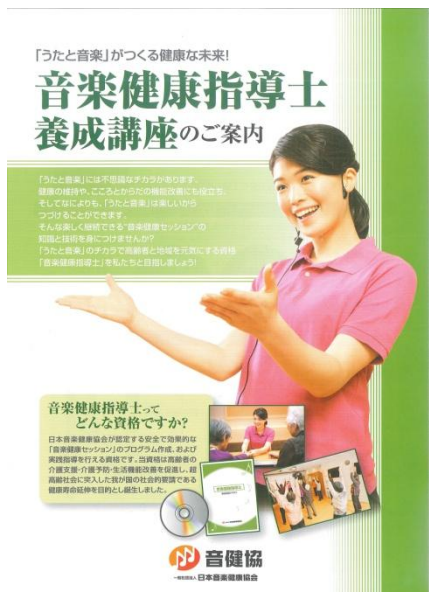
当日配布の養成講座ご案内