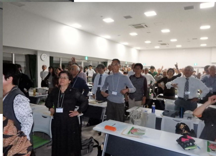
デモンストレーション映像を観ながら運動を行う参加者