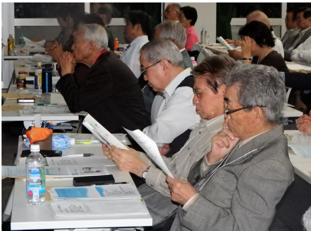
全国大会午後の部参加者は、約180名