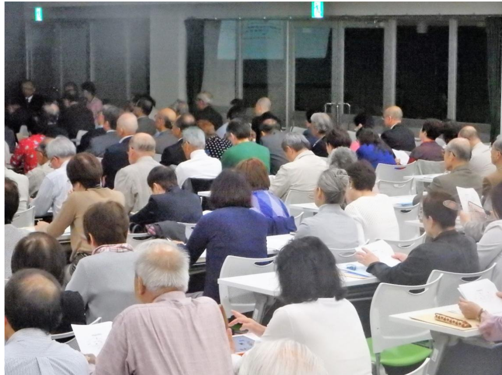
公開講座参加者は、約250名