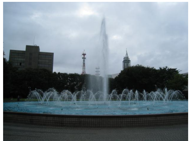
資格認定研修会場近くの公園