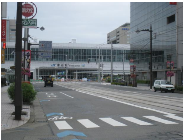
北陸新幹線が開通した JR 富山駅前

2015 年 8 月 22 日(土)、23 日(日) 於:サンシップとやま(富山市内) 受講者:5 名(男性 4 名、女性 1 名) 年齢 50 代~60 代)