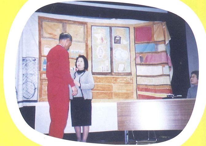
劇団はっぴーず (認知症予防劇)