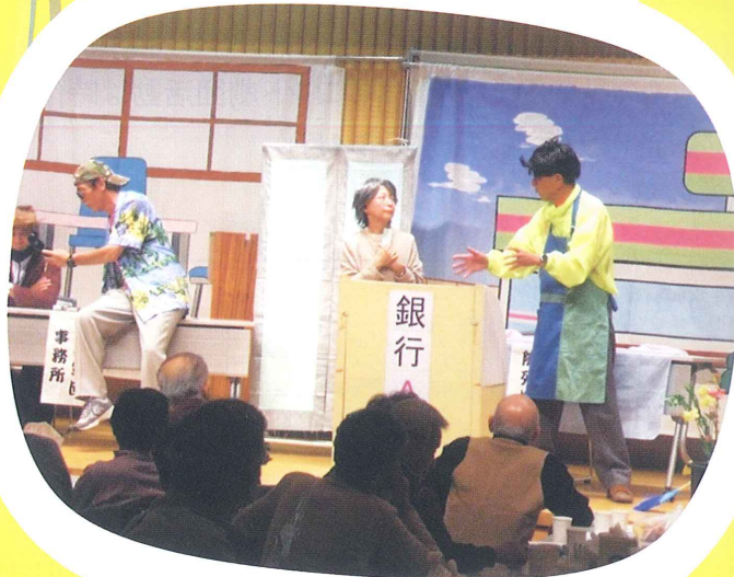
劇団イースターズ (悪質商法劇)